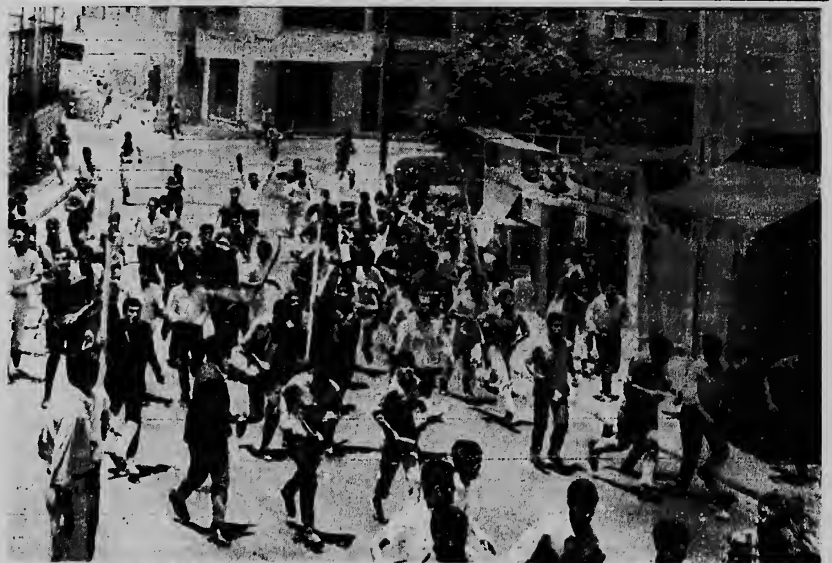
Turbanan anti-norteamericano aki ta corriendo den cayanan di Beirut, arma cu palu y piedra pa nan bai ataca e edificio di embahada di Merca. Nan a hanja un truck mericano den caminda y nan a sendele na candela.

Di e otro weganan den Liga Americana: New York a gana Washington den e segundo partido di un doubleheader, despues cu nan a perde e prome 2-1, California a blanquea Orioles di Baltimore 2-0. E doubleheader cu tabatin programma entre Boston y Chicago, mescos cu e singel game entre Cleveland y Minnesota a ser suspende pa awacero.